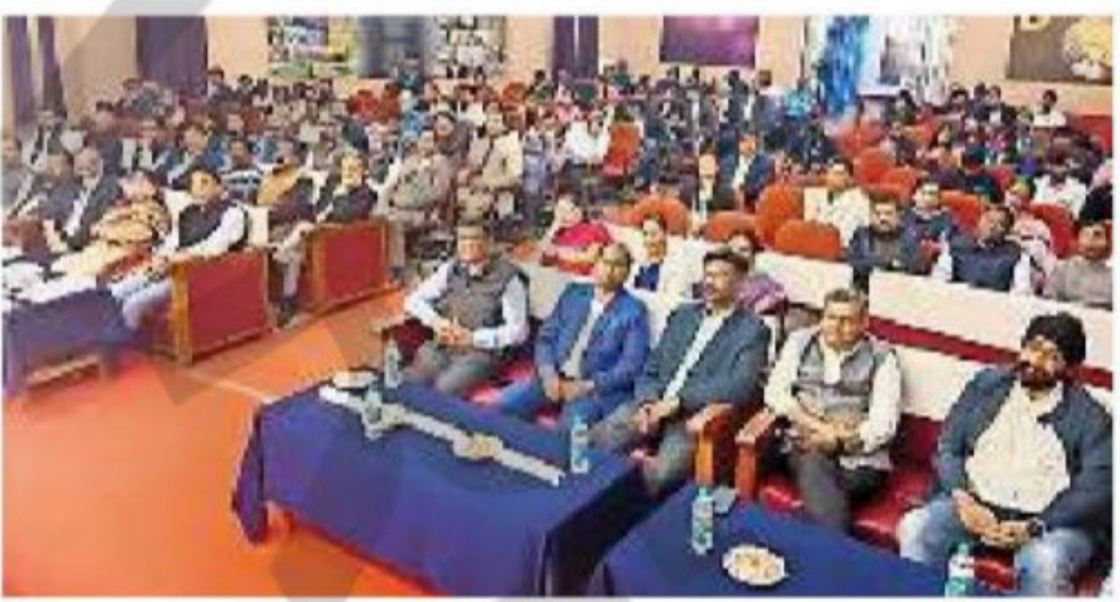
आयोजन में शामिल लोग 🌘 जागरण