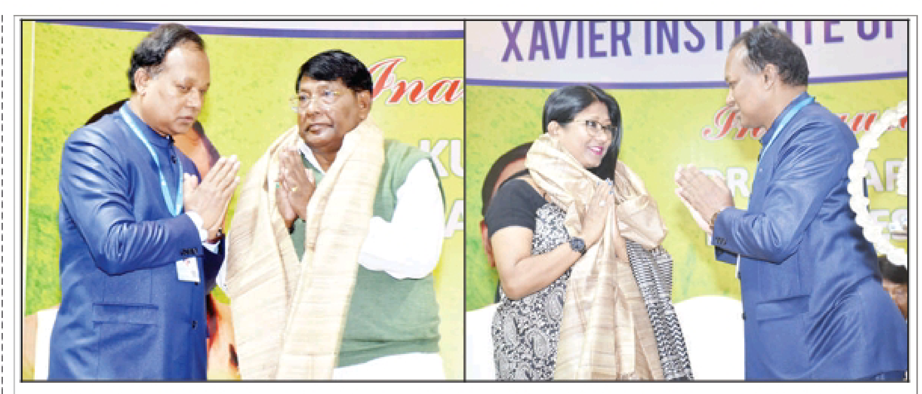
Jharkhand Finance Minister Rameshwar Oraon and JMM Rajya Sabha MP Mahua Majhi were felicitated during the inauguration of Tribal Research Centre in Ranchi on Wednesday, November 16, 2022.